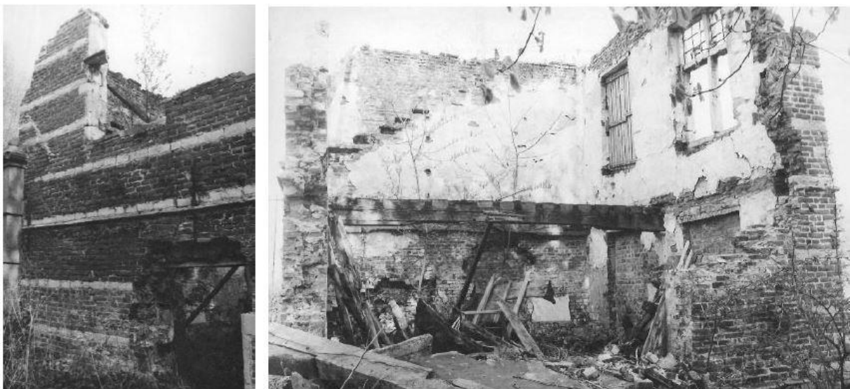
Figuur 35. Vlaamse Gemeenschap 1975.

Mogelijk hebben die ontwikkelingen niet bijgedragen aan de conservering van dit gebouwtje. Ook wordt er in de literatuur gesuggereerd dat de instorting te maken zou hebben met militaire vliegtuigen die door de geluidsbarrière vlogen.