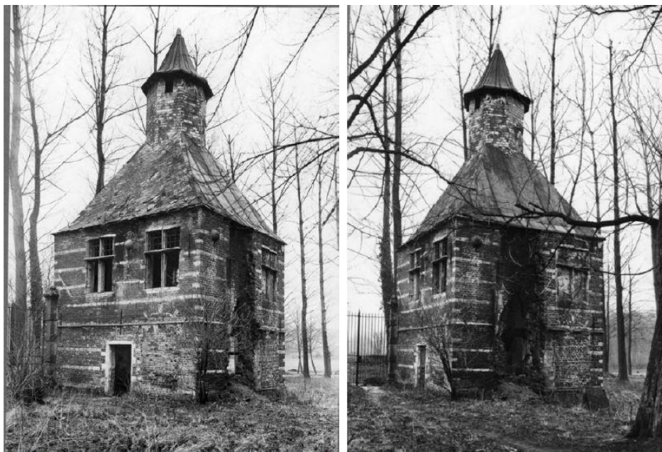
Figuur 33. De rechter foto toont kant C en kant D.

Alhoewel het paviljoen niet in de directe omgeving van het Wittemgebouw van het kasteel ligt, werd het in het vroege beschermingsbesluit van 1947 al opgenomen en verwees men expliciet naar het feit dat het lag aan de ingang van het park. Het werd beschermd op basis van de belangrijke oudheidkundige en geschiedkundige waarde.